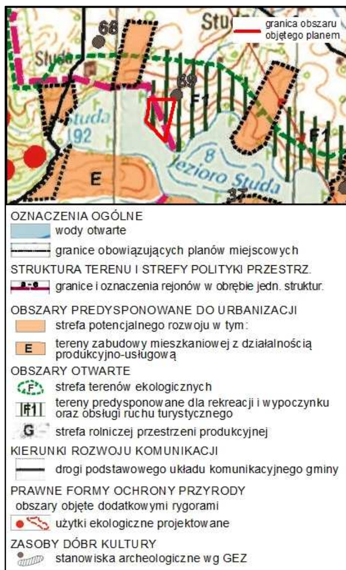
Rysunek 1. Wyrys ze Studium uwarunkowań i kierunków zagospodarowania przestrzennego gminy Nowe Miasto Lubawskie dla działek o numerach ewidencyjnych 294/7 i 299/2 z obrębu geodezyjnego Jamielnik.