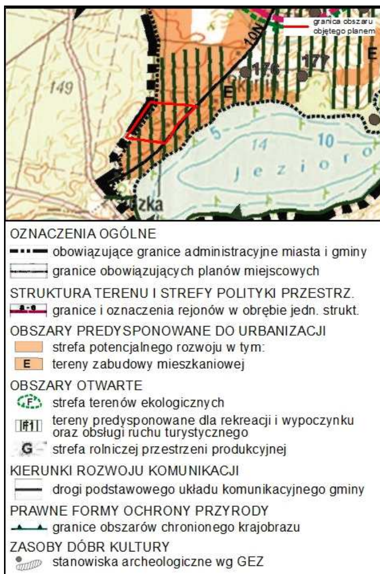
Rysunek 1. Wyrus ze Studium uwarunkowań i kierunków zagospodarowania przestrzennego gminy Nowe Miasto Lubawskie

Plan miejscowy przyjmuje główne cele i kierunki Studium oraz jego ustalenia dotyczące zasad zagospodarowania przestrzennego, ochrony środowiska przyrodniczego i kulturowego, kierunków rozwoju infrastruktury komunikacyjnej i technicznej.