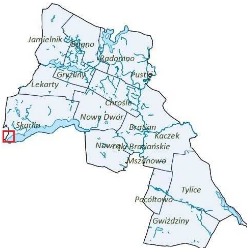
Rysunek 2. Orientacyjna lokalizacja obszaru objętego planem.