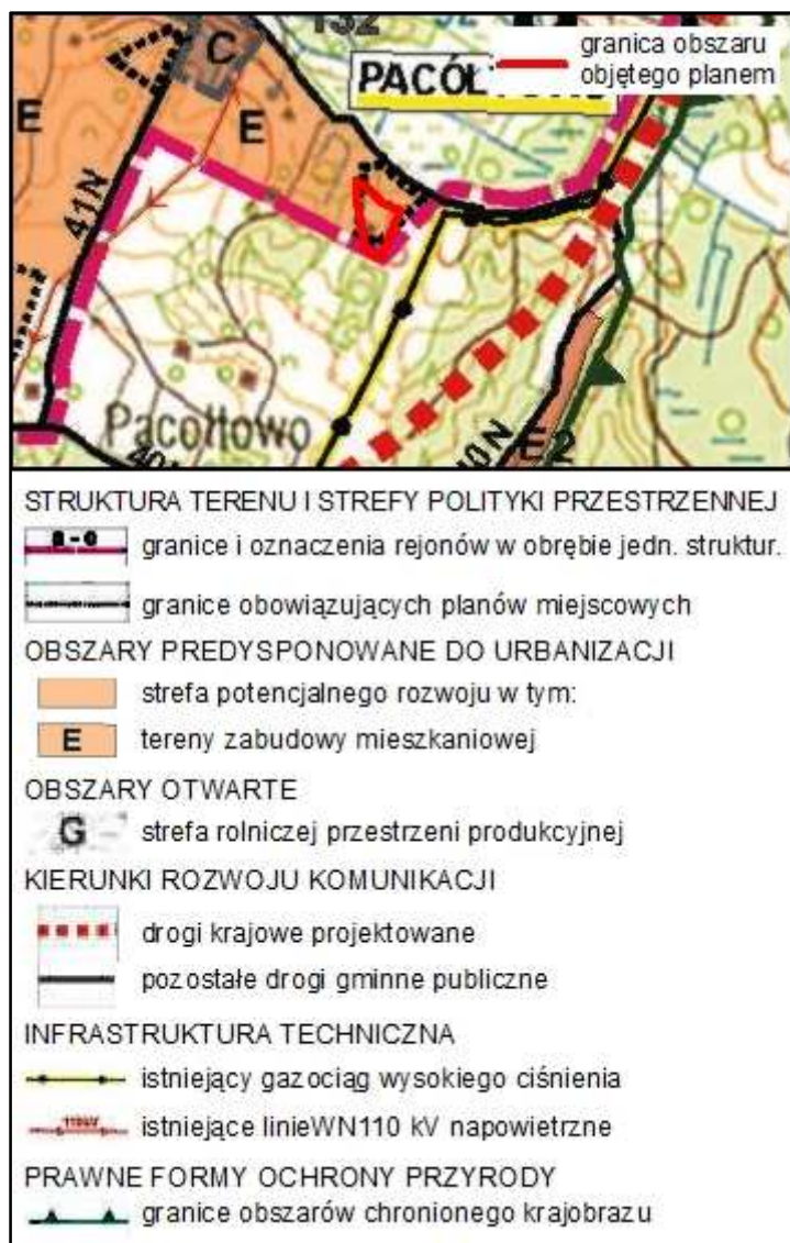
Rysunek 1. Wyrys ze Studium uwarunkowań i kierunków zagospodarowania przestrzennego gminy Nowe Miasto Lubawskie.