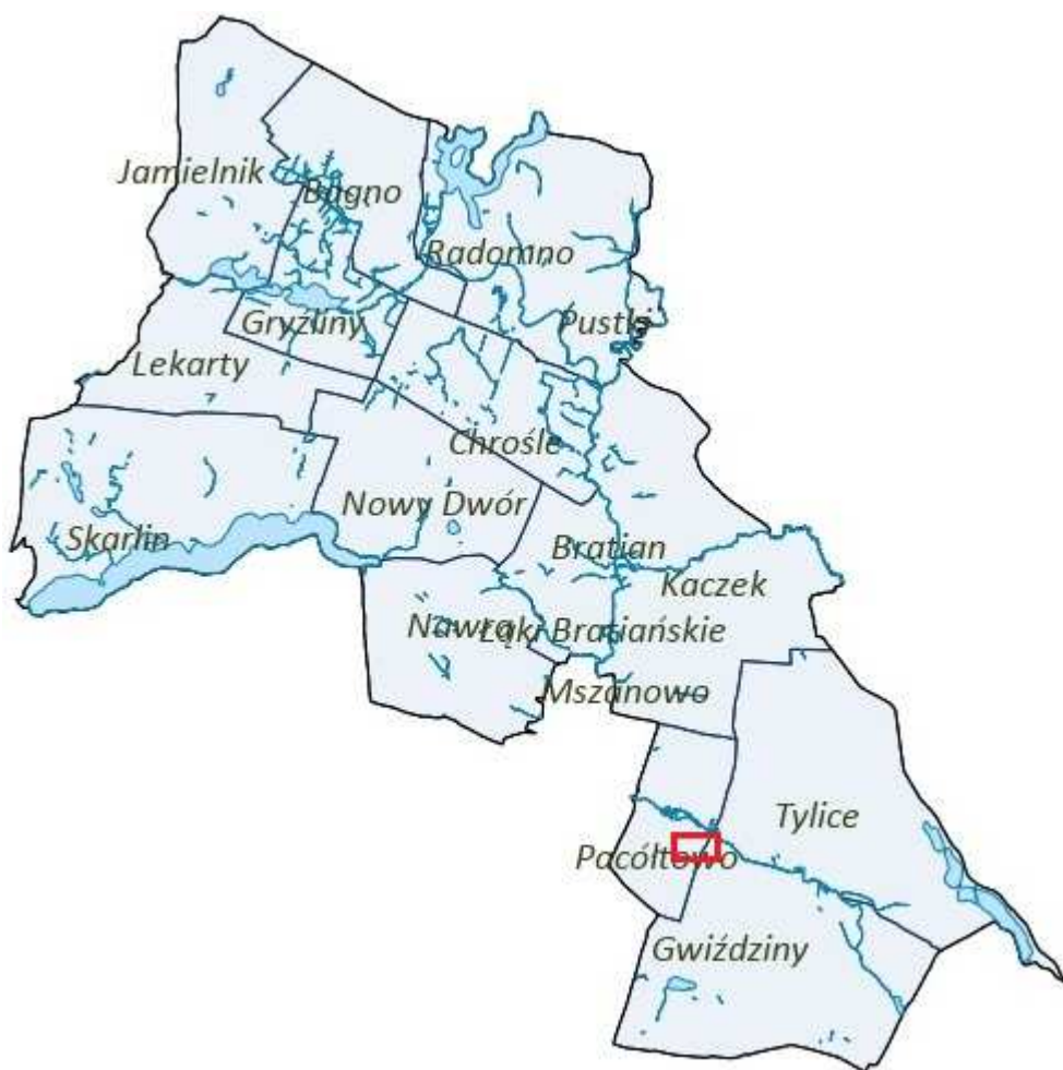
Rysunek 2. Orientacyjna lokalizacja obszaru objętego planem.