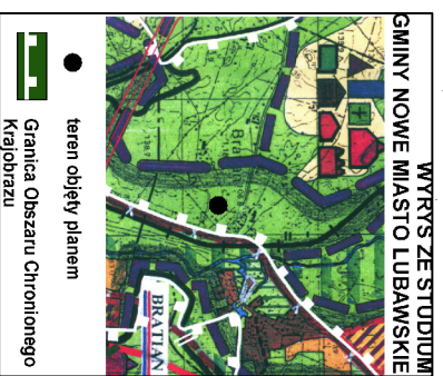
WYRYS ZE STUDIUM GMINY NOWE MIASTO LUBAWSKIE Krajobrazu

● teren objęty planem ■ Granica Obszaru Chronionego Krajobrazu