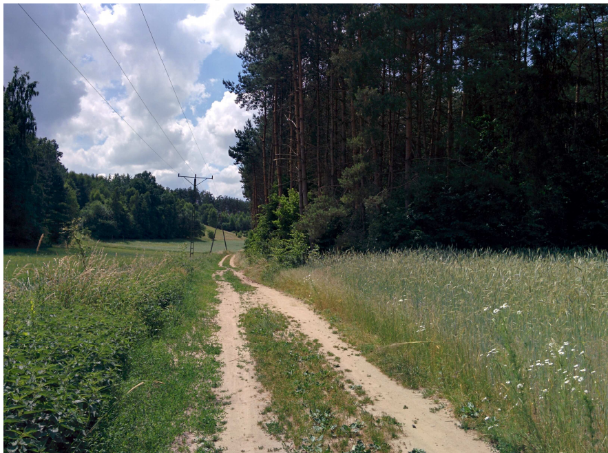
Zdjęcie 2. Sąsiedztwo obszaru objętego planem.

W rejonie obszaru opracowania występuje krajobraz rolniczy, na który składają się tereny otwarte upraw rolnych oraz krajobraz leśny.