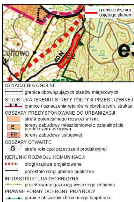
Rysunek 1. Wyrus ze Studium uwarunkowań i kierunków zagospodarowania przestrzennego gminy Nowe Miasto Lubawskie