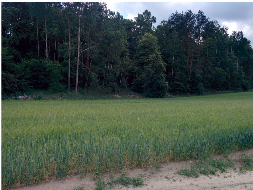
Zdjęcie 1. Roślinność na obszarze objętym planem.