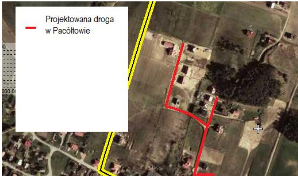
Ryc. 3 Projektowana droga w Pacółtowie