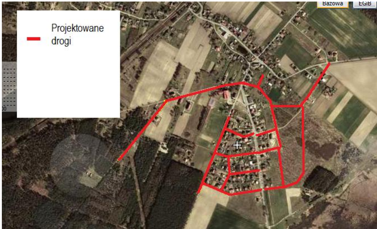
Ryc. 2 Projektowana sieć dróg w Jamielniku