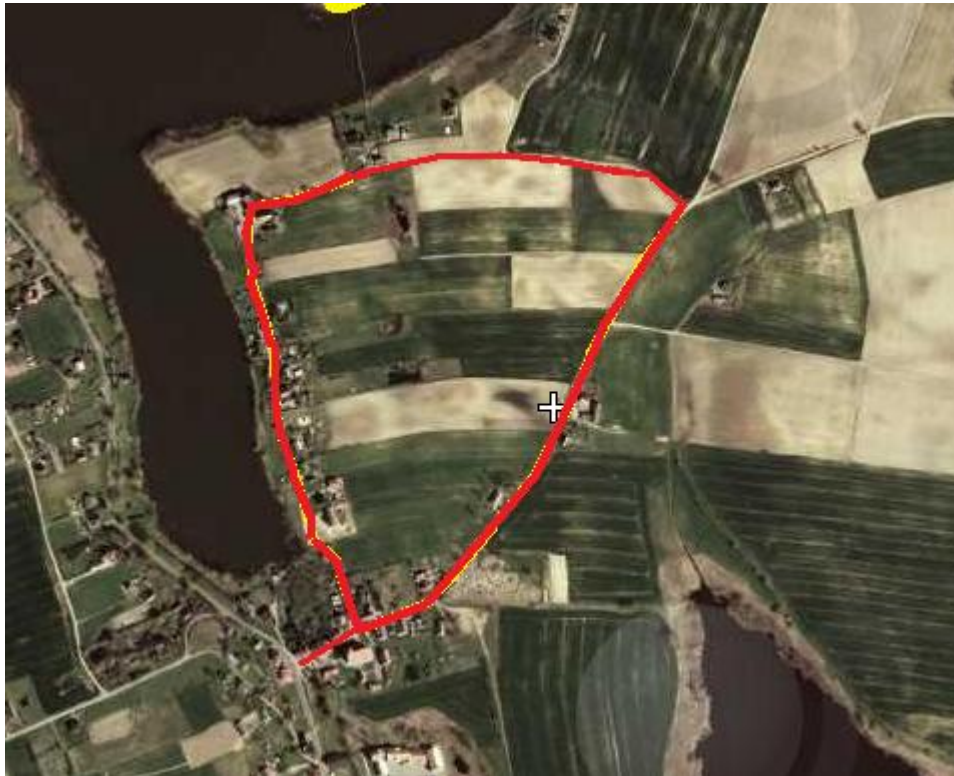
Ryc. 1 Projektowana droga w Radomnie