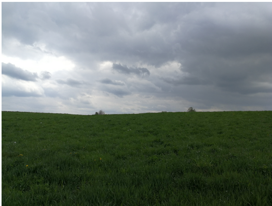
Zdjęcie 1. Roślinność na obszarze objętym planem.