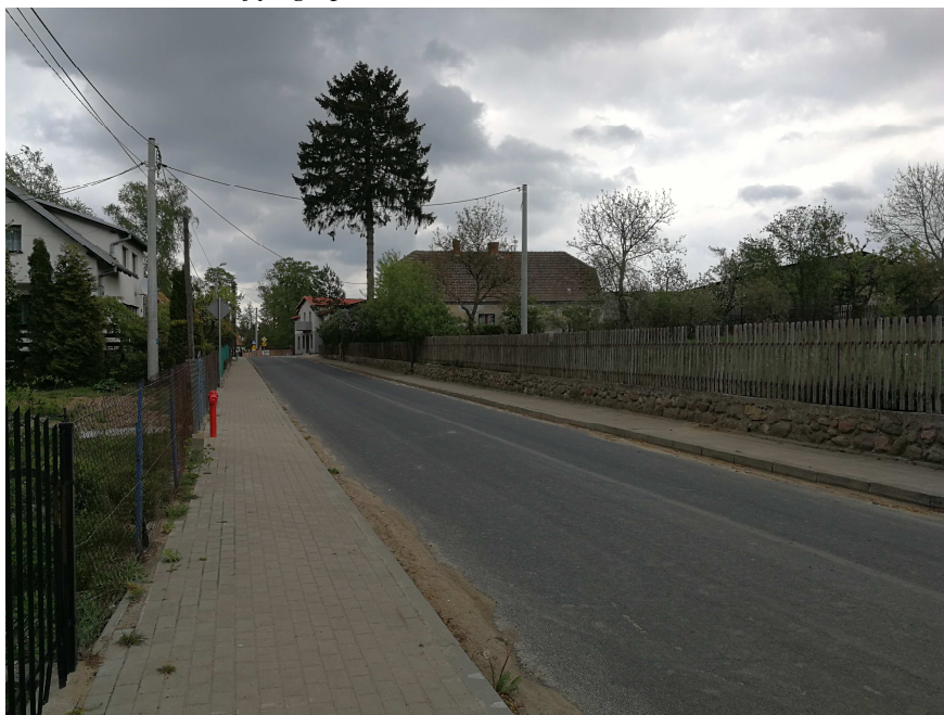
Zdjęcie 2. Sąsiedztwo obszaru objętego planem.

W rejonie obszaru opracowania występuje zabudowa zagrodowa oraz zabudowa mieszkaniowa jednorodzinna.