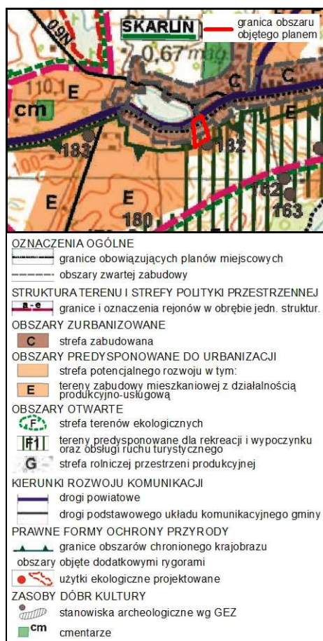
Rysunek 1. Wyrys ze Studium uwarunkowań i kierunków zagospodarowania przestrzennego gminy Nowe Miasto Lubawskie